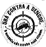
EDVALDO BAIÃO ALBINO (Vadinho Baião) Prefeito de Ubá