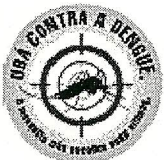
EDVALDO BAIÃO ALBINO (Vadinho Baião) Prefeito de Ubá