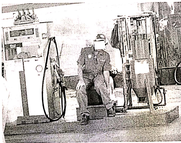
Frentista utilizando galão de óleo como assento

É importante destacar que muitos postos de Ubá seguem a norma, porém, outros ainda a contrariam, conforme demonstrado na foto abaixo: