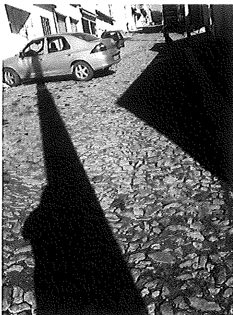
Rua Edgard Lemos Duarte