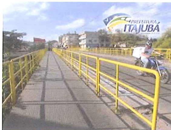
Imagem de guarda-corpo instalado em uma ponte na cidade de Itajubá, para conhecimento:

Assim, na expectativa de contar com o apoio dos nobres pares, firma.