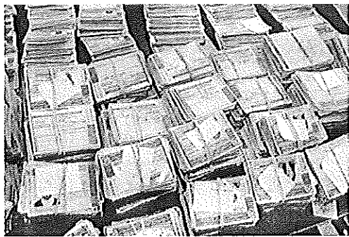
Projeto-piloto é realizado em São Bernardo do Campo

O Departamento Estadual de Trânsito de São Paulo (Detran-SP) realiza em São Bernardo do Campo, no ABC, um projeto-piloto que monitora o condutor e o examinador durante o trajeto das provas práticas de direção da categoria B (carro). O objetivo da medida é tornar a aplicação do exame prático mais precisa e coibir possíveis irregularidades, como o pagamento da chamada 'quebra' para ser aprovado.