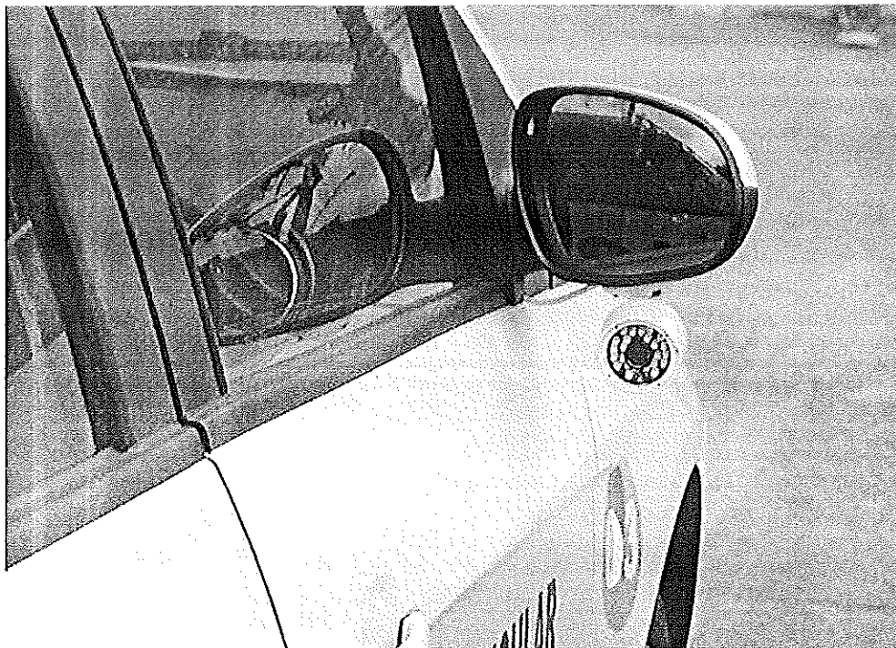
Carros contarão com sensores e câmeras para registrar o que acontece no automóvel

Diferentemente do que acontece hoje, onde as provas práticas são realizadas no carro da autoescola, em São Bernardo os exames acontecem em um veículo de uma empresa contratada pelo Detran-SP. Ele já vem equipado com câmeras e microfones. A comparação desses dados com as informações relatadas pelo examinador vai tornar o resultado da prova mais preciso.