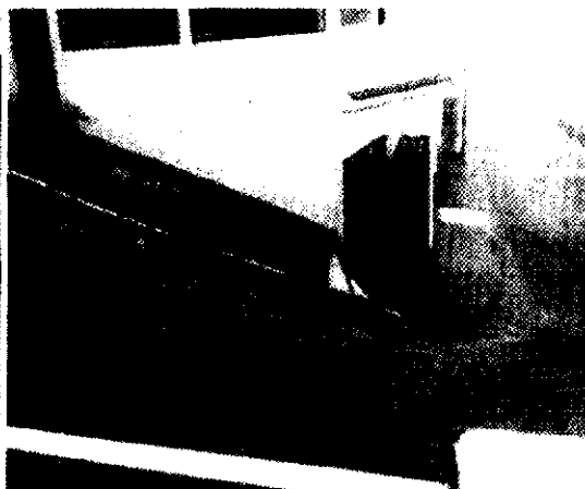
Figura 2: Enchente no Bairro Santa Bernadete em 2013

Em anexo, há outras fotos da situação relatada acima, bem como proposição legislativa, do Edil abaixo-assinado, endereçada ao Executivo Municipal.