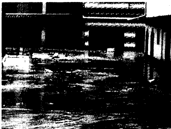
Figura 1: Enchente no Bairro São Domingos