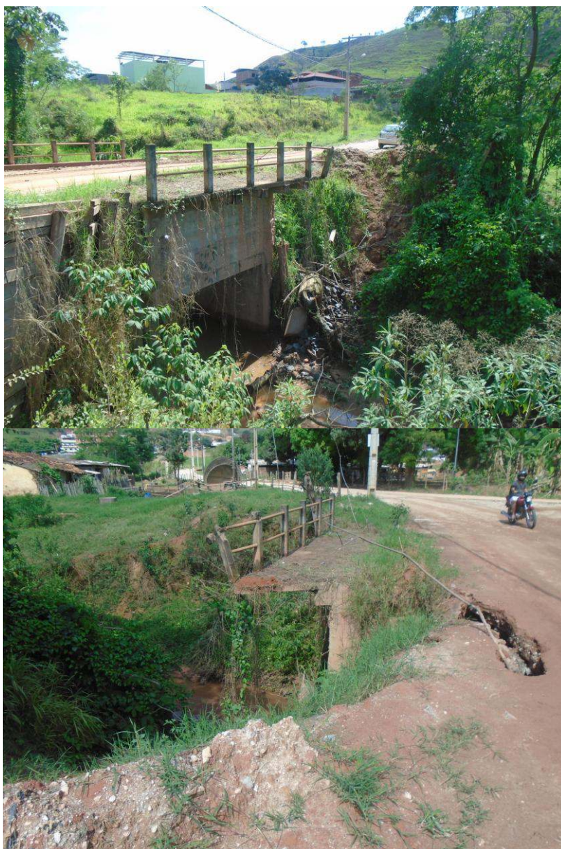
Figura 1: Ponte na Rua Recreio-Bairro Rosa Toledo